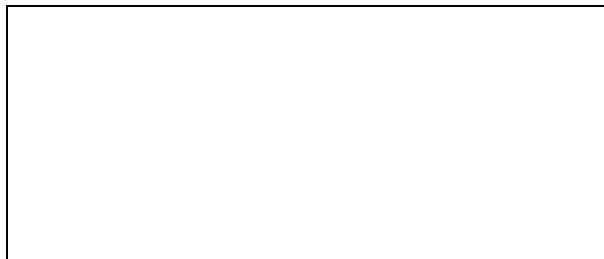
Схема границы балансовой принадлежности тепловых сетей

Прочие сведения по установлению границ раздела балансовой принадлежности тепловых сетей _____